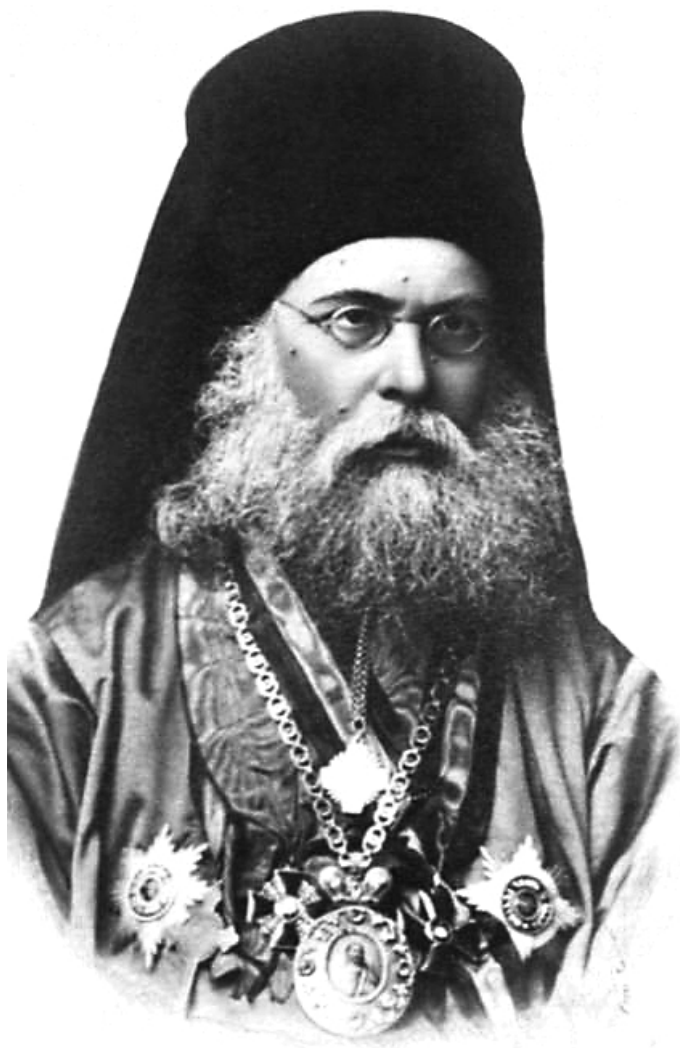
Преосвященный Владимир (Петров), епископ Бийский, начальник Алтайской духовной миссии. Конец XIX в.

«Миссионер Киргизской миссии протоиерей Филарет Синьковский назначен вторым помощником начальника Алтайской и Киргизской миссий Томской епархии – 12 июля».