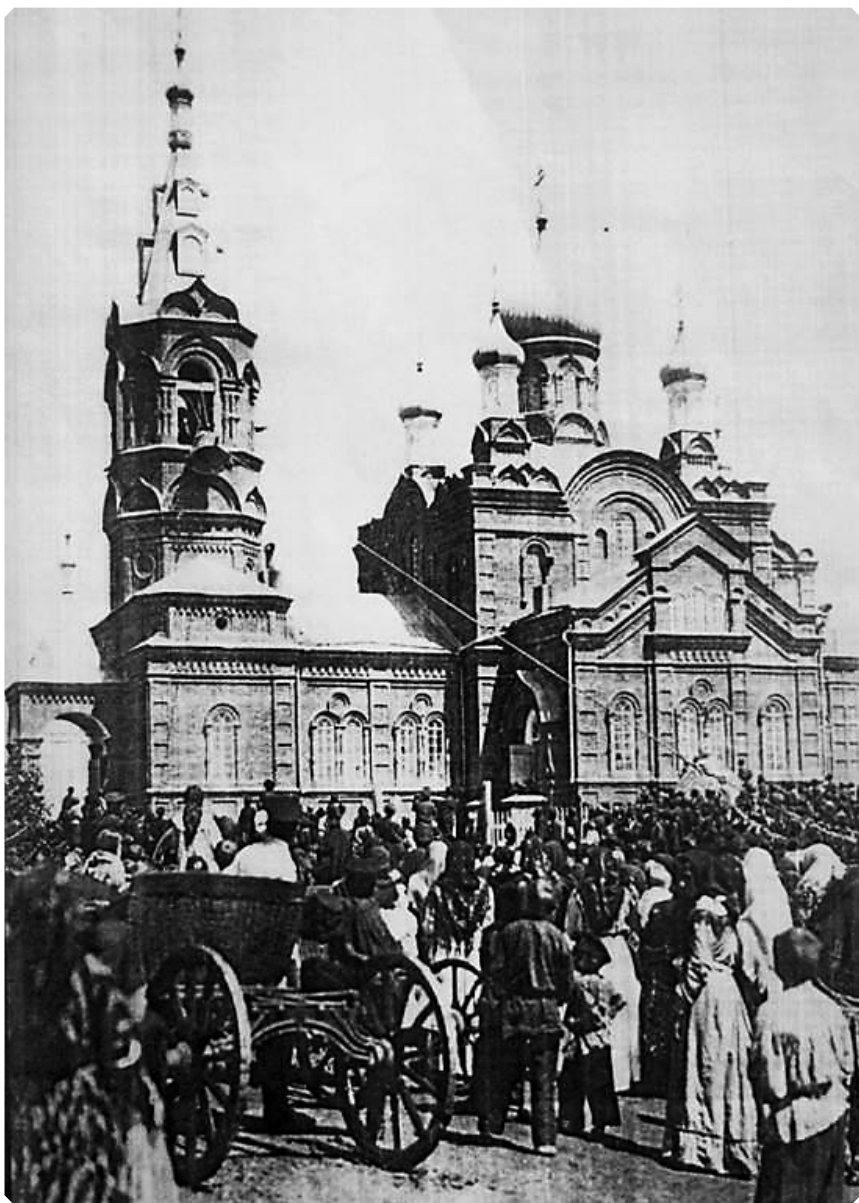
Церковь Святителя и Чудотворца Николая. с. Верх-Ануйское. 1908 г. Краеведческий музей с. Верх-Ануйского

Согласно «Справочной книге по Томской епархии за 1902–03 гг.» в селе Верх-Ануйском «строится каменная церковь, во имя Святителя и Чудотворца Николая», к приходу по-прежнему относятся: с 1885 г. местная приписная церковь во имя Святой Троицы и построенный тремя годами ранее Михаило-Архангельский молитвенный дом в деревне Ново-Смоленской. В селе действуют второклассная церковно-приходская школа, открытая в 1897 г., одноклассные мужская (с 1885 г.) и женская (с 1894 г.) церковно-приходские школы. Из сведений о священно-церковнослужителях, изложенных в этом справочнике, известно, что старшим священником Верх-Ануйского прихода в этот период был племянник святителя Макария Алтайского – Иоанн Лаврентьевич Невский, 43 лет. На приходе под его началом служили: младший священник Александр Васильевич Воробьев 1 , 42 лет,