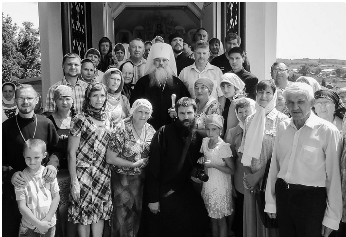
Прихожане вновь освященного храма села Новозыково и духовенство Алтайской митрополии во главе с митрополитом Сергием. 21 июня 2015 г. Фотогалерея сайта Алтайской митрополии