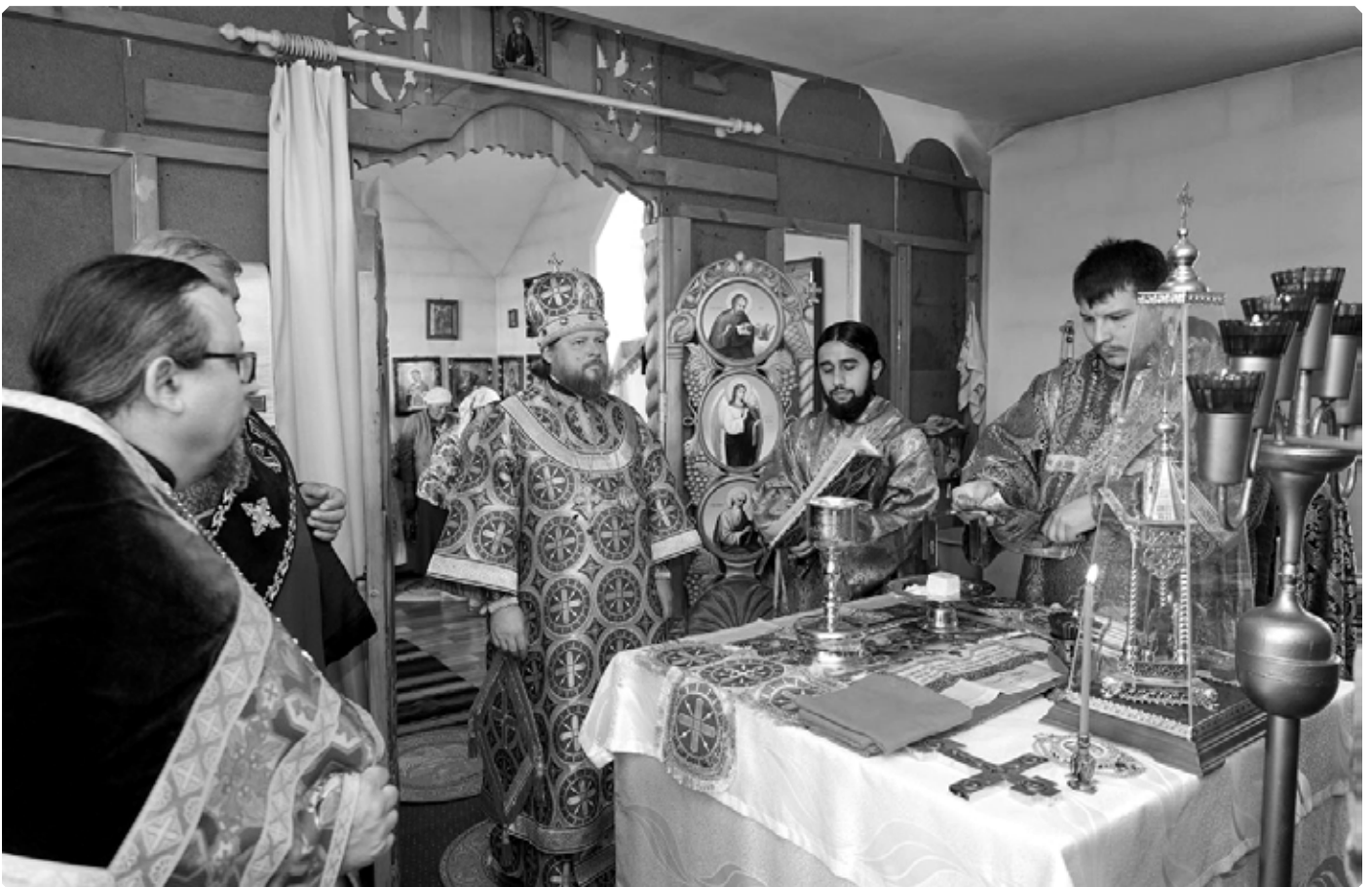
В алтаре Новозыковского храма.