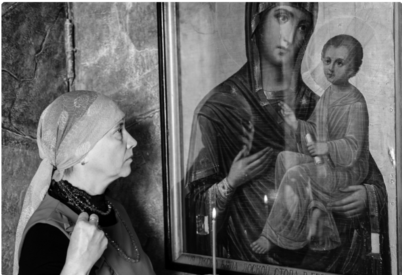
«Богородице, христианом Помощнице, Твое предстательство стяжавше раби Твои, благодарно Тебе вопием...» Автор публикации пред Тихвинской иконой Божией Матери в Успенском кафедральном соборе города Бийска. Май 2020 г.

В результате он оказался в реанимации. Когда его у меня забирали, врач сказала: «Ты молодая, еще шестерых родишь». Почему именно шестерых? Со мной была настоящая истерика! В голове крутилась фраза: «Бог дал – Бог взял». Вот именно, Бог дал!