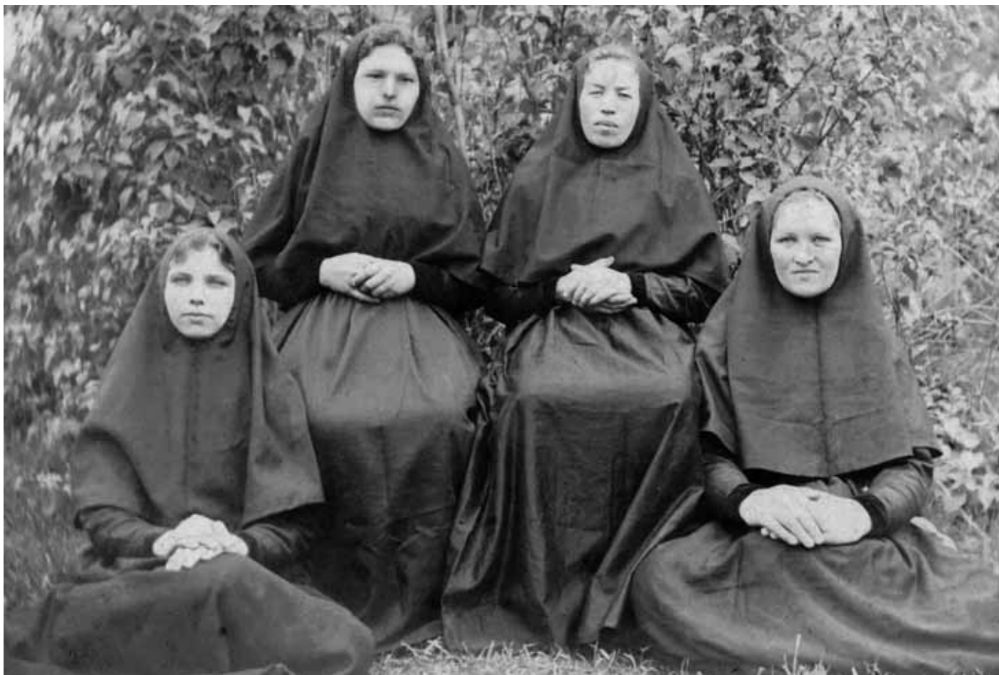
Инокини Бийского Тихвинского женского монастыря. Начало XX в. МАДМ