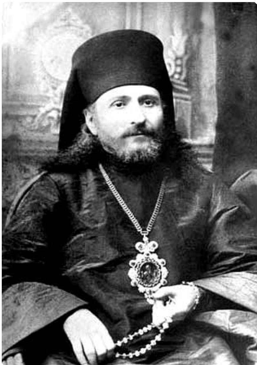
Преосвященный Владимир (Синьковский), епископ Бийский, викарий Томской епархии. 1890-е гг. МАДМ

«6 июля. Причетник села Плешковского Григорий Александровский переведен в село Бобровское, благоч. № 18».