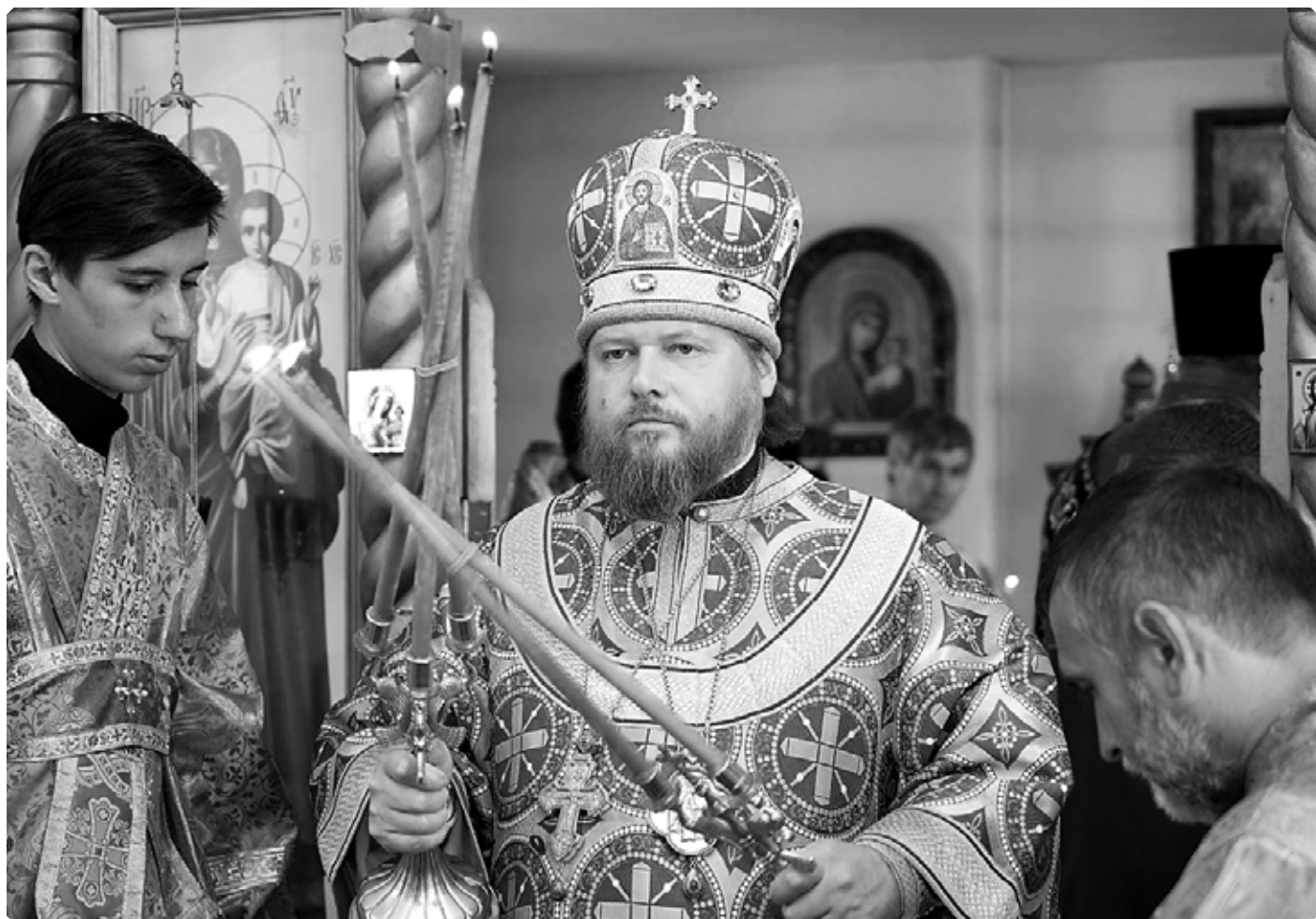
Преподобный Серафим, епископ Бийский и Белокурихинский.

Почтовый адрес: чрез Улалинское почтовое отделение, Бийского уезда.