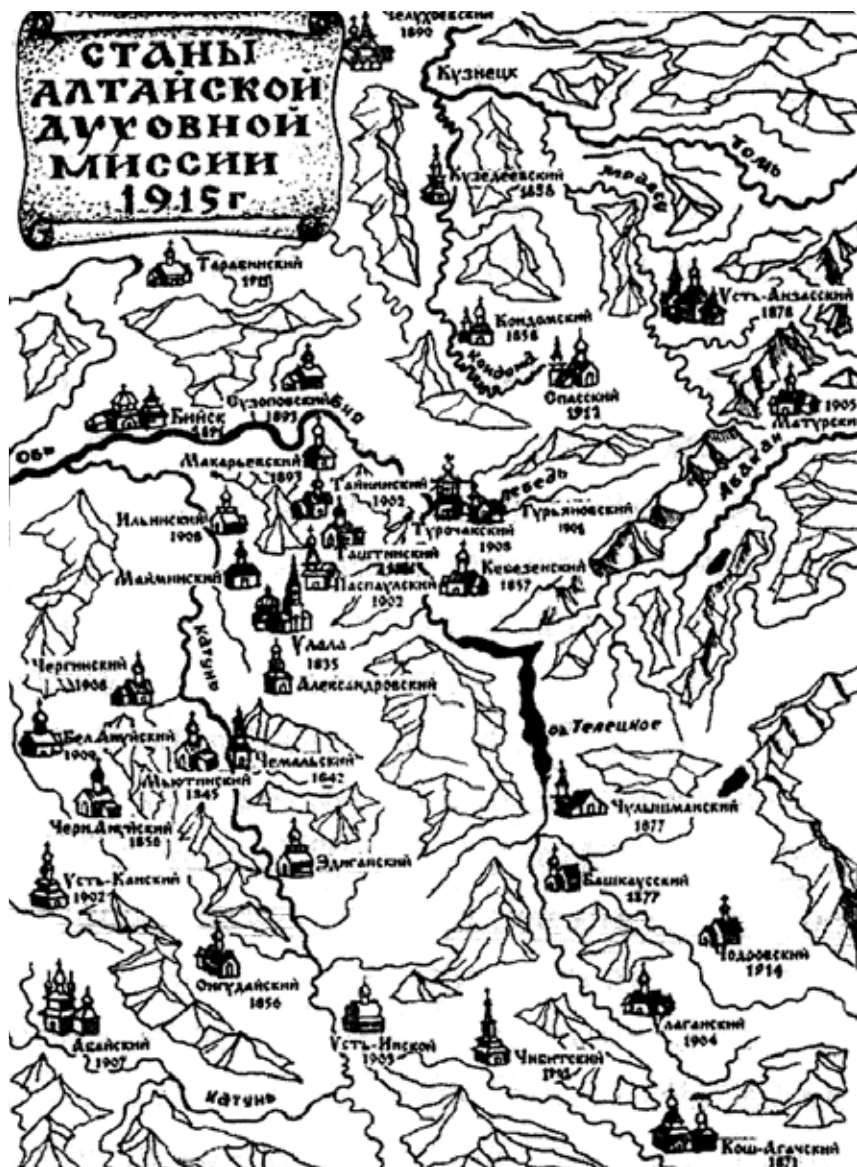
Карта «Станы Алтайской духовной миссии, 1915 г.».

«Темою в беседах с некрещеными мы брали большею частью их же верования, стараясь войти в их мирозерцание. В этом отно-