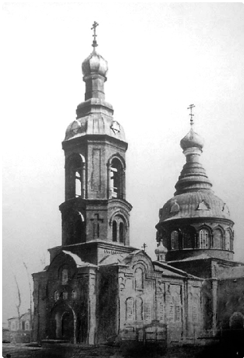
Градо-Бийская Александро-Невская церковь. 1910-е гг.