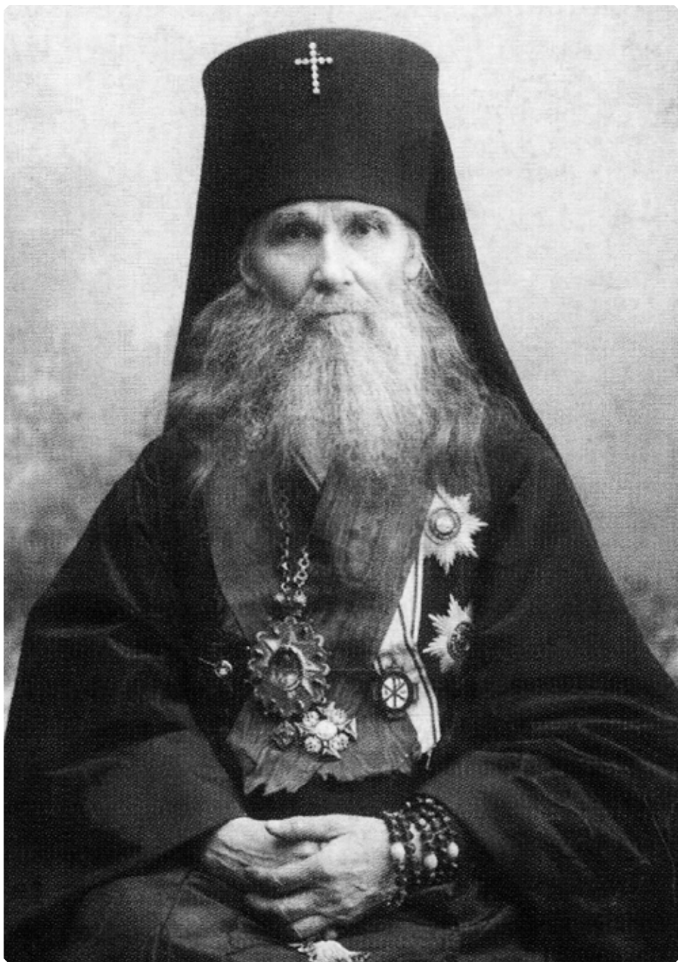
Преподобнейший Макарий (Невский), архиепископ Томский и Алтайский, фото ранее 1912 года

В начале XX века вследствие активного пе-