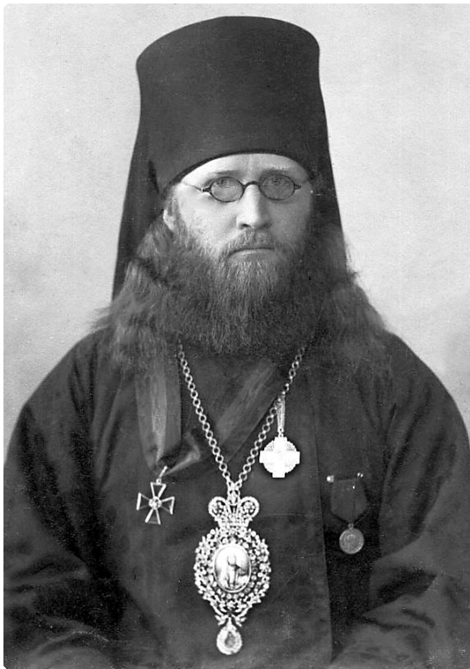
Преосвященнейший Макарий (Павлов), епископ Бийский. Начало XX века. МАДМ

После обычной встречи Владыка обратился со словом на тему: «Свете Тихий – Христос Иисус, просвещающий всякого человека. Закат солнца и закат человеческой жизни в уроках из жизни преподобного Макария Египетского». После поучения Владыка отслужил молебен преподобному Макарию Египетскому, в честь и память которого построен храм. По окончании молебна Преосвященный благословил каждого молящегося и, сопровождаемый народом при пении «Достойно есть...», проследовал в школьное здание на ночлег».