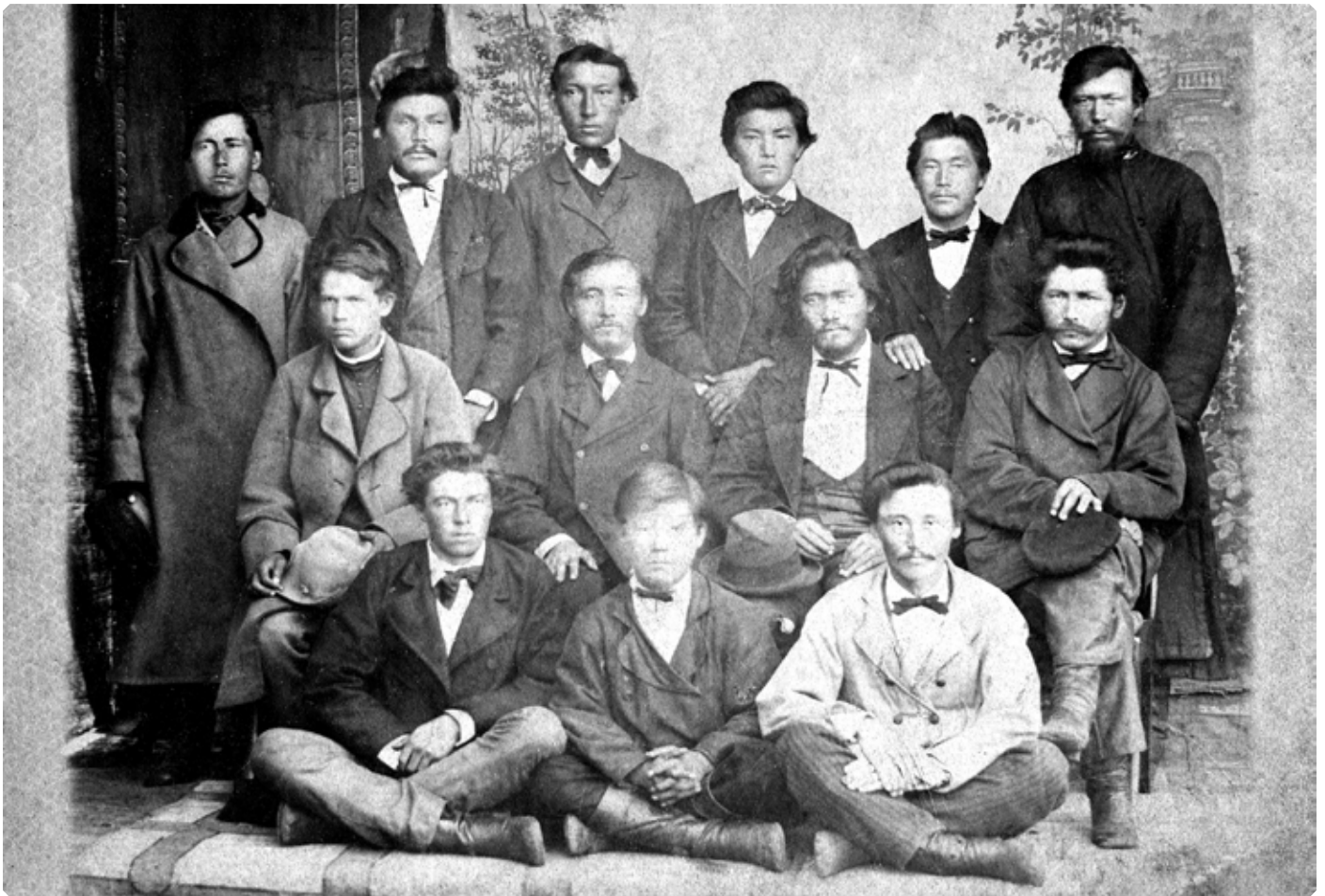
Учителя миссионерских школ Алтайской духовной миссии в городе Бийске. 1891 г.