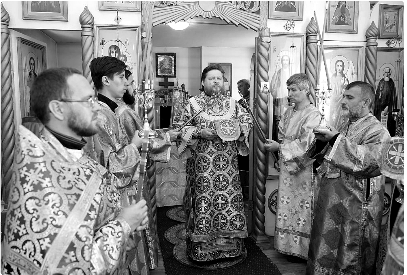
Епископ Бийский Серафим совершает праздничную Божественную литургию.