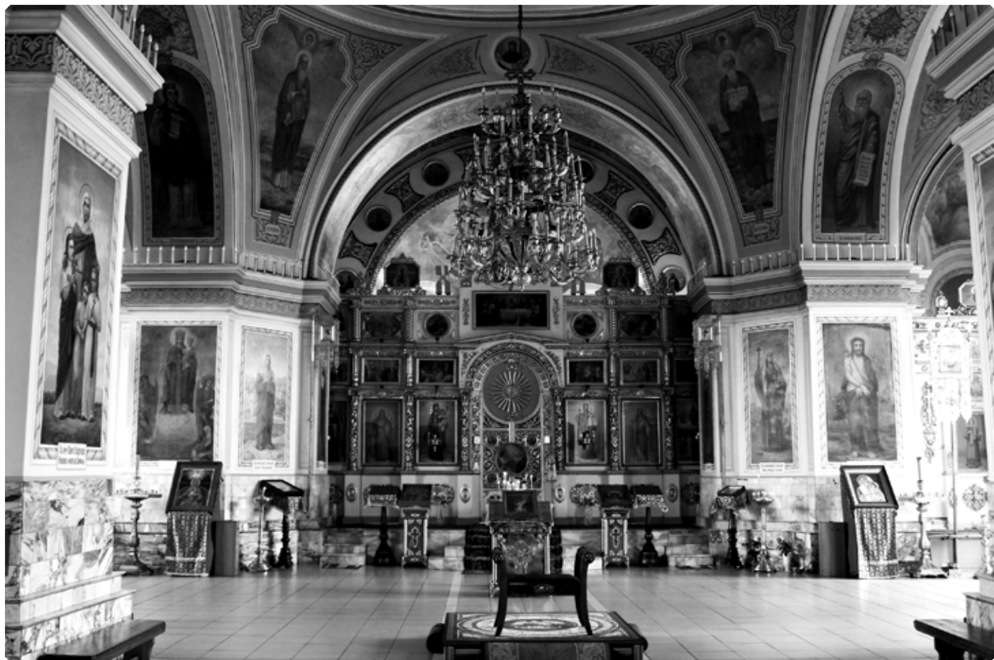
В Покровском кафедральном соборе города Барнаула

Его перевели в другую больницу. У меня появилась возможность приходить к нему через каждые три часа и кормить из бутылочки. Приехали в свое общежитие, когда ему уже почти месяц исполнился. Главной проблемой стало вскармливание. Смеси он никакие не принимал, и нас прикрепили к ближайшей молочной кухне, где мы брали ему питание. Жизнь налаживалась: мы продолжали учиться в институте, сын подрастал. А потом ребенок отравился... Как такое могло произойти?!