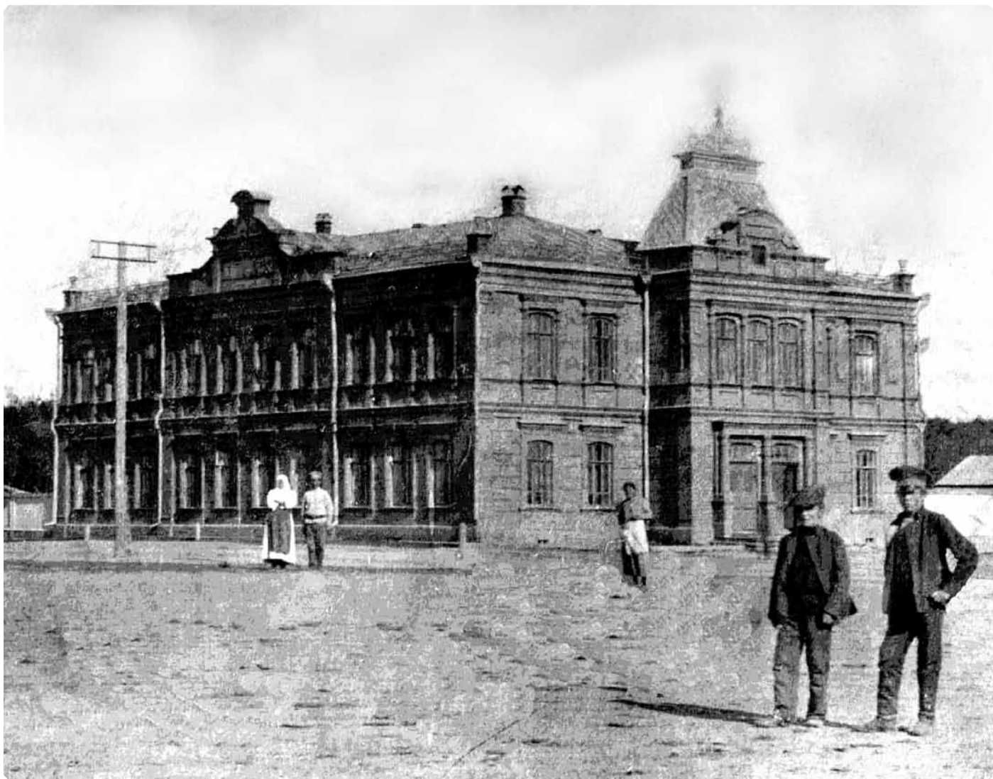
Здание Казанских мужского и женского приходских училищ. Начало XX в. МАДМ

«за усердие по церковно-школьному делу» в тот же период было преподано Архипастырское благословение.