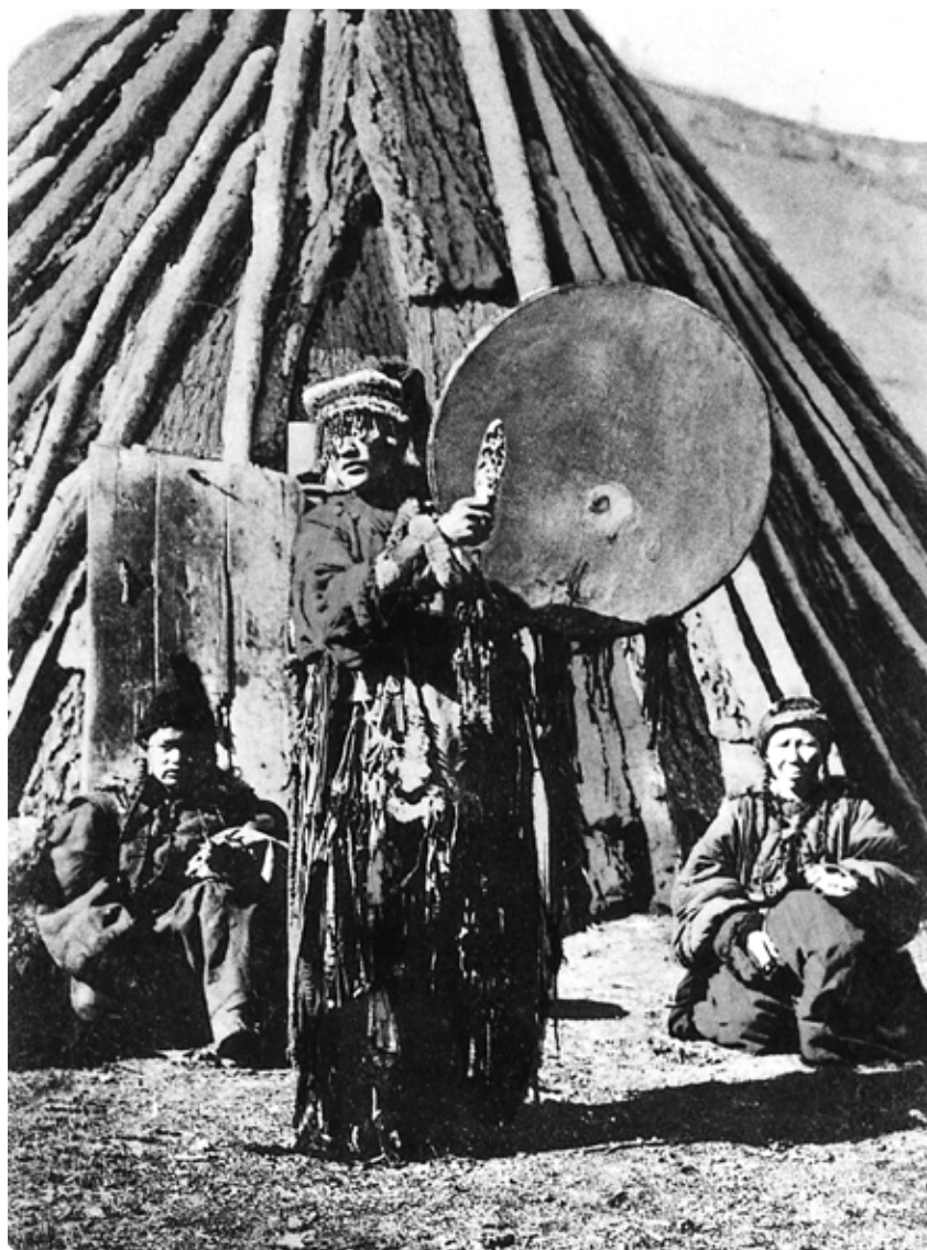
Алтайский шаман с бубном на фоне традиционного жилища – чаадыр. 1907–1914 гг.